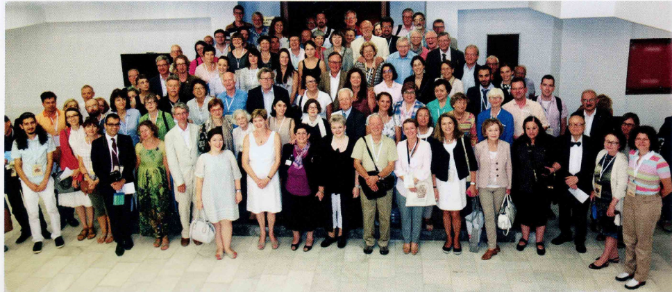
Kongre kapanış oturumunun ardından kongre katılımcıları hatıra fotoğrafı çekti.